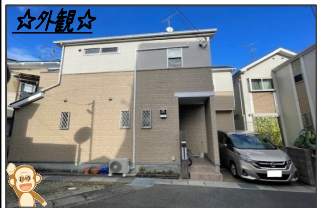
※略図に付、多少の差異はご了承下さい。

カーナビではグーグルマップに 長岡京市馬場見場走り 1-21 と入力して下さい! ご来場お待ちしております!